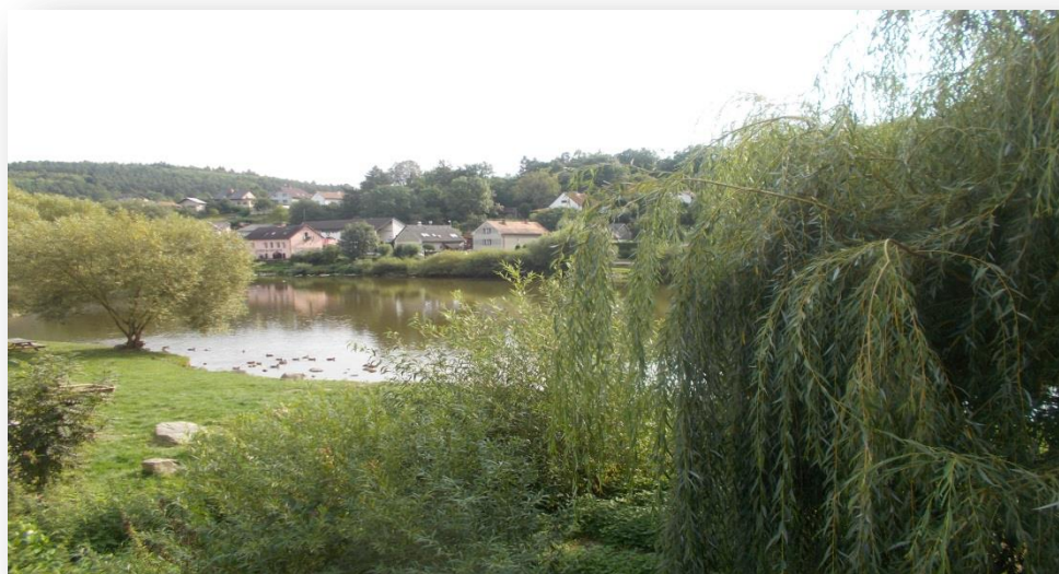
Pohled na řeku ze dvora